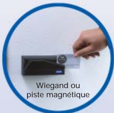
Wiegand ou piste magnétique