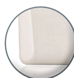
DINESS Gris claro