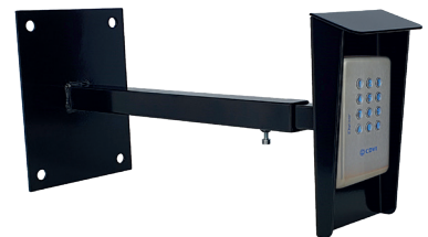
Väggfäste WMP1 med kodlås KCIEN

All the information contained within this document (pictures, drawings, features, specifications and dimensions) could be perceptibly different and can be changed without prior notice.