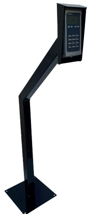
Stolpe GNP1C med kodlås Axema A66